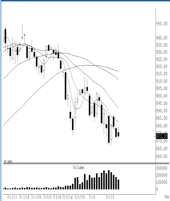
S50H25 (Close 873.30 Chg 0.50)